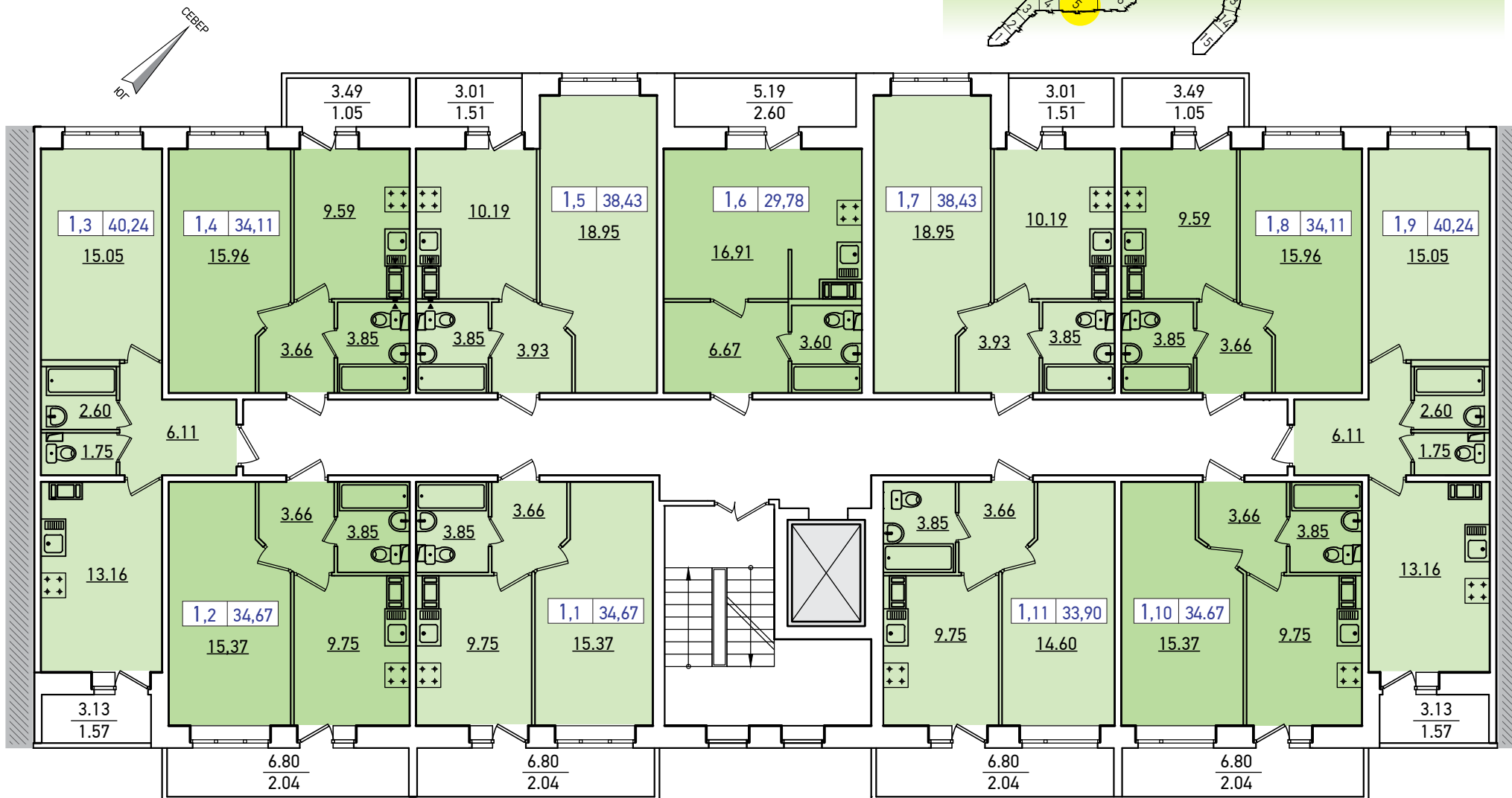
ПЛАН ТИПОВОГО ЭТАНА